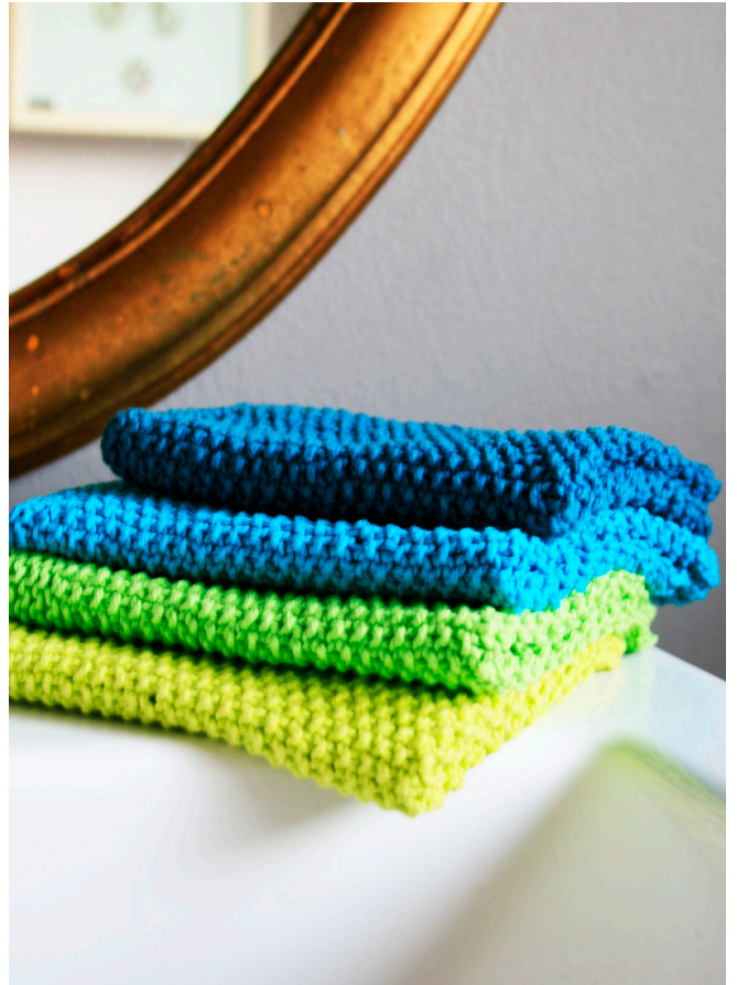
Layout og opskrift: Janne Aarre 2018 golfognatur.dk

1 nøgle 100% ren bomuld 3 nøgler = 2 klude